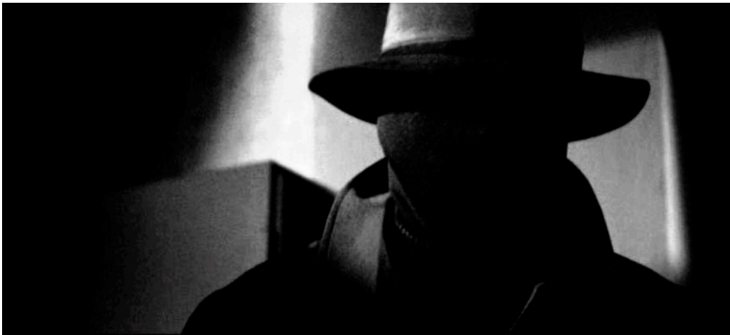
Abb. 1: Der Killer mit Mantel und Hut in Perché quelle strane gocce di sangue sul corpo di Jennifer?