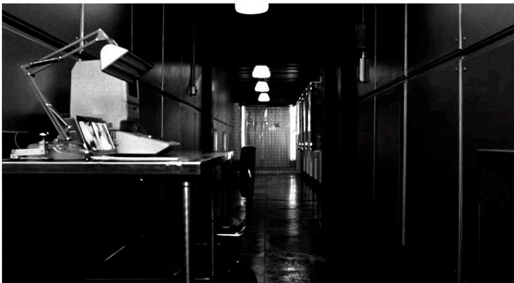
Abb. 3: Der Folterkeller

Wie oben erwähnt, verändert sich mit dem Betreten der Kellerräume durch Anna auch die visuelle Ebene in Martyrs ; die Raum- und Lichtgestaltung sowie die Kameraführung. Die Räume in kühler Edelstahloptik werden durch langsame, sehr ruhige und geradlinige Fahrten erkundet. Die Perspektiven sind dabei vorwiegend statisch und der Symmetrie des Raumes angepasst. Die Räume werden vornehmlich durch helles, künstlich wirkendes Licht ausgeleuchtet.