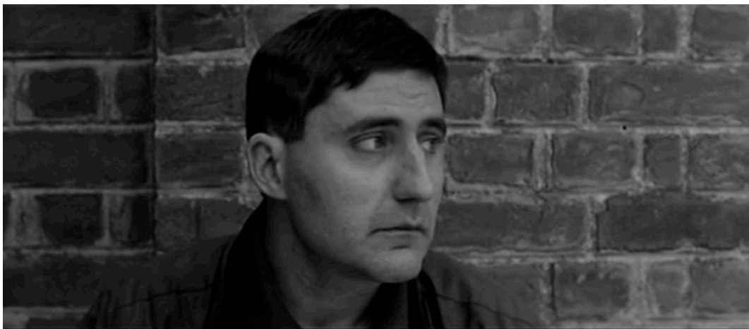
Abb. 3: L'humanité

Estelle Bayon sieht in dieser Großaufnahme, die zweifelsohne an Gustave Courbets L'origine du monde erinnert, einen visuellen Angriff auf das Publikum: »En utilisant le gros plan comme un fragment qui vient briser un ensemble, Dumont fait un cinéma obscène car la blessure de l'oeil du public est engendrée par ce choix du cinéaste qui écrit visuellement ce choc, fait le choix de heurter en rompant son discours cinématographique.« 17 Durch die Abfolge der Einstellungsgrößen und ihre somatische Affizierung entledigt sich Dumont der Notwendigkeit einer konventionellen Erzählstruktur und schafft elliptisch eine Verbindung zwischen der Mädchenleiche und Pharaon. Über die Großaufnahmen des Gesichts und des Körpers transportiert er – trotz der chronologischen Versetzung – ohne Worte und Erklärung die Grausamkeit der Tat sowie das Entsetzen und den gefühlten Horror. Neben solchen visuellen Schocks setzt