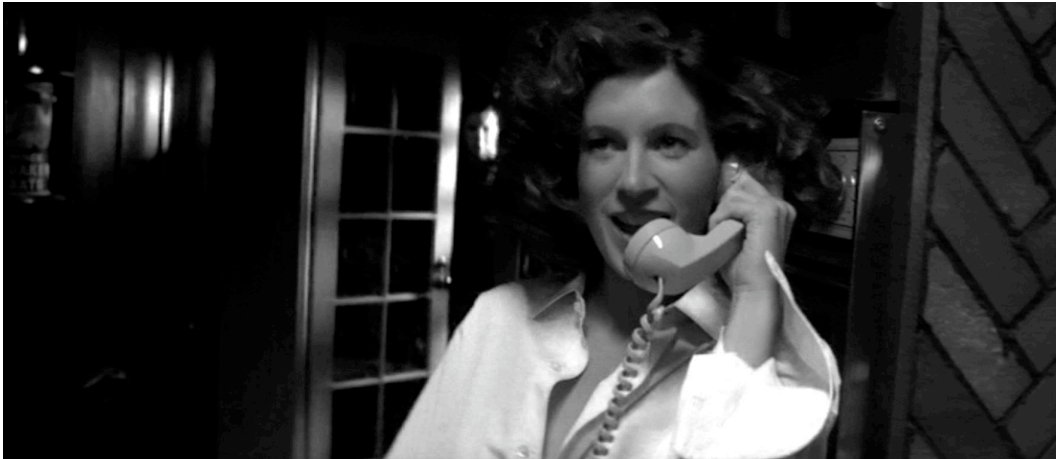
Abb 1: Myers lauert hinter der Terrassentür. Die Küche wird zum bedrohten Raum (48. Minute)

In der 80. Filmminute nämlich ist der bedrohte Raum, Lauries stets nur temporärer und labiler Sicherheitsbereich, auf das Schlafzimmer herabgeschrumpft und verkleinert sich dort noch einmal auf den Wandschrank (Abb. 2).