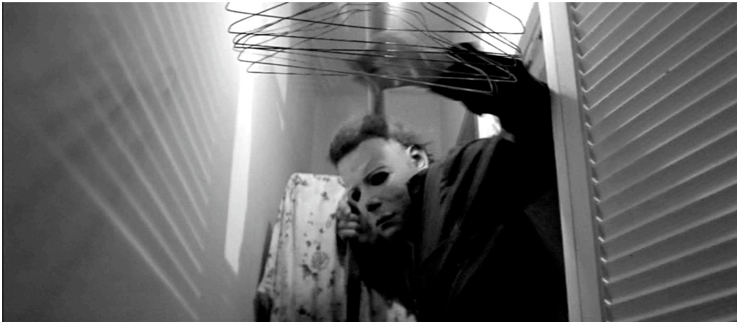
Abb 3: Myers durchdringt die letzte architektonische Hülle (81. Minute)

Jetzt, da also Lauries Körper gewissermaßen selbst zum letzten bedrohten Raum geworden ist, soll sich auch unser Raumbegriff ändern. Dies aber erfordert neues theoretisches Rüstzeug, das wir erstens durch eine logische Erweiterung unseres bisherigen Modells der konkurrierenden Raumkonzepte erlangen wollen, um es zweitens mit Luce Irigarays sexualphilosophischen Ausführungen zum »Zwischenraum« zu unterfüttern.