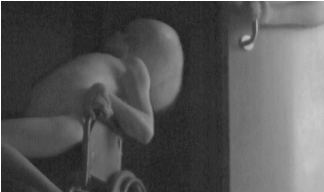
Abb. 3: Daddy is coming: Der Trip ist vorbei

Mit Lust an der Inszenierung bizarrer Fantasien lässt Cunningham den Körper von Johnny Morphen, dehnt ihn in den dunklen Raum hinein und die Musik in den geschundenen Körper. In seiner Gestaltung wie auch in seiner rudimentären Narrativik ist Rubber Johnny in höchstem Maße absurd, gar unvorstellbar, wäre da nicht Cunninghams Montage und Choreographie, die Johnnys Tanz für uns in seiner Performanz sinnlich erfahrbar machen.