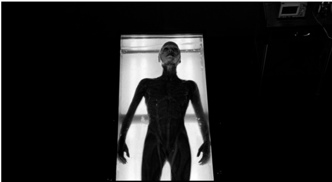
Abb. 5: Anna als Cyborg

Annas Körper entzieht sich dem transgressiven Spiel und schreitet, ohne zu sterben, in den unbegrenzten Bereich ein, der durch ihre Körperdarstellung seine visuelle Repräsentation findet. Hier ist nun ein vollkommen entgrenzter Körper, horizontal in einem Tank liegend, und nur innerhalb einer fluiden Substanz überlebensfähig, wie ein Cyborg im ursprünglichen Sinne, der alleine in Kombination mit Objekten zu einem ganzen Wesen werden kann, geöffnet zu einem anderen Universum, nur noch ein reiner Informationsstrom – ein vollkommenes, postsexuelles Cyberwesen.