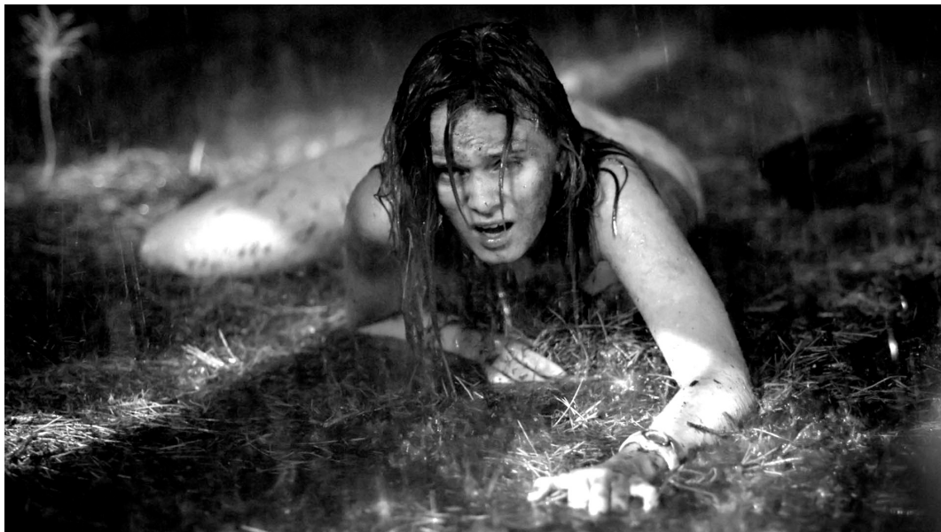
Abb. 1: Szene aus The Last House on the Left

Eindeutiger und rasanter als der Rape-Revenge -Film in den letzten Jahren ist ein Filmgenre wohl selten wieder aus der kinematografischen Versenkung aufgetaucht. Zuerst kam 2009 The Last House on the Left (USA 2009), dann 2010 I Spit on Your Grave (USA 2010) und Mother's Day (USA 2010), 2011 Straw Dogs (USA 2011) – die Remakes von US-Klassikern der 1970er und frühen 1980er Jahre sowie zahlreiche neue Produktionen zeugen von einem wiedererstarzten Interesse von FilmemacherInnen und Publikum an den Erzählungen von Verbrechen und Vergeltung, Schuld und Sühne, Gesetz und Gerechtigkeit im Spannungsfeld von (Geschlechter-) Differenz, Sexualität und Gewalt.