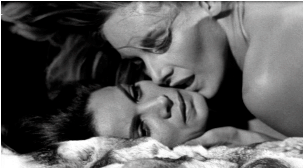
Abb. 4: Trauma der Protagonistin in Una lucertola con la pelle di donna .

seine eigene Homosexualität schämt und deshalb zum Mörder wird. In Riccardo Fredas L'iguana dalla lingua di fuoco (Italien/Frankreich/D 1971) ist es der schwule Sohn eines Diplomaten, der durch einen Mord des Vaters dazu angeregt wird, sich durch das Töten von schönen Menschen an der Welt für seine unterdrückte queerness zu rächen. Auch in Lucio Fulcis Una lucertola con la pelle di donna (Italien/ES/Frankreich 1971) führt die repressive Homosexualität der Protagonistin zu einer schizophrenen Doppelsexistenz. Als ihr Geheimnis enthüllt zu werden droht, tötet sie ihre Geliebte. Der weibliche Körper ist hier fetischisiert, wobei eine direkte Verbindung von weiblicher Homosexualität zu mörderischer Gewalt behauptet wird. Allerdings führt der Film hier durchaus einen Meta-Diskurs: Denn um den Verdacht von sich abzulenken, scheint die Protagonistin selbst diese Verbindung bewusst zu manipulieren, indem sie ihre Weiblichkeit mit neurotischen Störungen assoziieren lässt. Für sie wird der Geschlechtskörper dadurch zu »einem gelebten Ort der Möglichkeit«, zu »einem Ort für eine Reihe sich kulturell erweiternder Möglichkeiten«. 13 Dass der Gebrauch ihrer Lüste dabei zur Katastrophe führt, zeichnet Una lucertola con la pelle di donna weniger als individuelles Verschulden denn als notwendiges Produkt einer phallisch-patriarchalischen Gesellschaftsordnung. Der wahre Schrecken liegt im Horror der Heteronormativität.