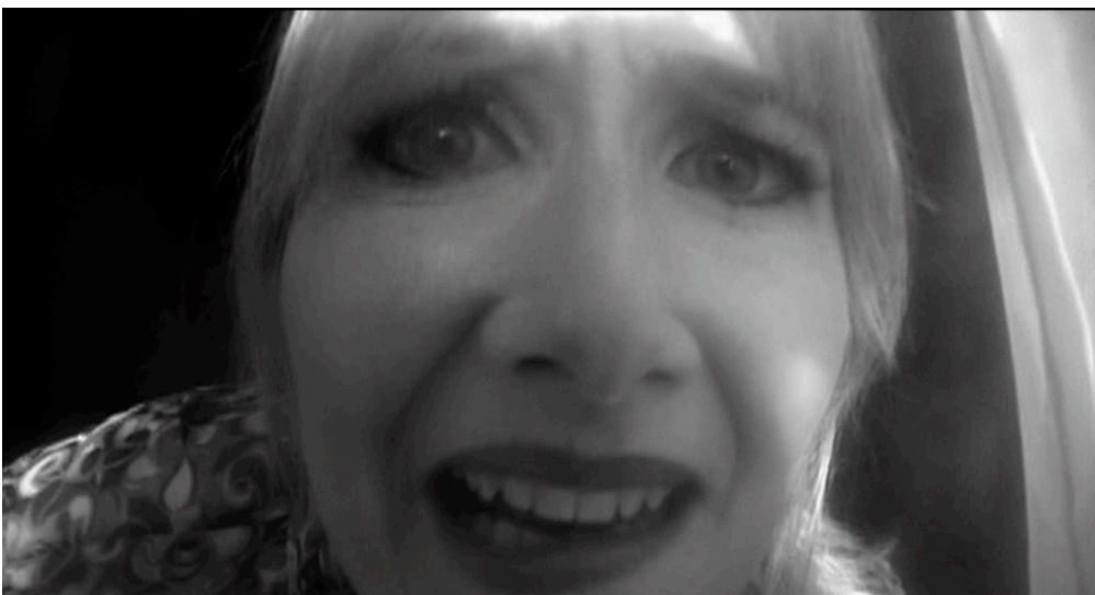
Abb. 1/Abb. 2/Abb. 3: Die Gesichter der Laura Dern