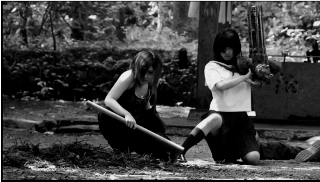
Abb. 2: Das Gewehr statt des linken Armes und eine Freundin statt der Familie. Vor dem entscheidenden Kampf in The Machine Girl .