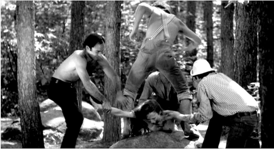
Abb. 2: Vergewaltigungsszene aus I Spit on Your Grave von 1978