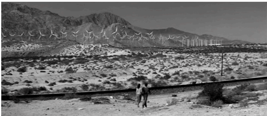
Abb. 1: Twenty-nine Palms

Entgegenkommende Autos bleiben aus, befestigte Straßen werden durch staubige Pisten und Fahrten durchs Gelände ersetzt. Parallel zu dieser allmählichen Reduzierung ändert sich auch die Relation von Körper und Natur: Von einem Stop bei