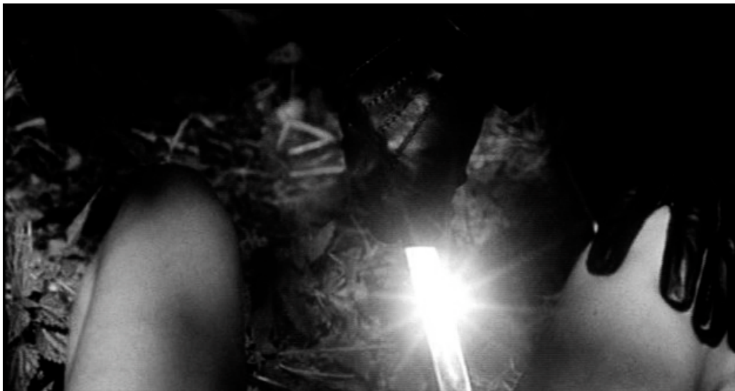
Abb. 2: Phallisierung der Mordwaffe in Massimo Dallamano's Cosa avete fatto a Solange? (Italien/D 1972).

bewusst würde. Diese Motivation führt über die Verleugnung des nicht-existenten weiblichen Phallus zur Materialisierung eines Ersatzes: des fetisch-Objekts. Jacques Lacan hat Freuds Gedanken aufgegriffen, die Konzeption vom Phallus als Synonym für den Penis jedoch modifiziert. Lacan begreift den Phallus abstrahiert vom biologischen Geschlechtskörper als symbolische Struktur, die als Zeichen des Begehrens nicht mehr auf den organisch-anatomischen Penis des Mannes verweist, sondern der Ordnung der Sprache angehört. Indem der Phallus den Penis symbolisiert, fällt er gerade nicht mit ihm in eins: »Der Phallus ist ein Signifikant«, heißt es in einer berühmten Passage bei Lacan, »ein Signifikant nämlich, dessen Funktion in der intrasubjektiven Ökonomie der Analyse vielleicht den Schleier hebt über die Funktion, die er in den Mysterien einnimmt«. Als Grund dafür gilt Lacan die Sonderstellung des Phallus: »Denn es ist der Signifikant, der dazu ausersehen ist, die Effekte der Signifikate in ihrer Gesamtheit darzustellen, insoweit sie der Signifikant durch seine Präsenz als Bedeutungsträger bedingt« 5 . Der Phallus als Signifikant erzeugt Bedeutung, und weil die Frau nicht über ihn verfügt, bleibt sie aus der symbolischen Ordnung exkludiert. Der Mann hingegen kann als imaginären Ersatz für den fehlenden Phallus der Frau einen Fetisch aufbringen, der ihm den Zugang zum Reich der Sprache gewährt.