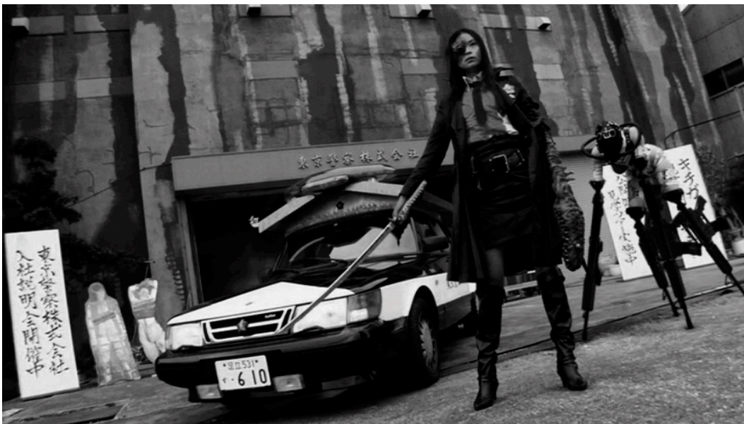
Abb. 3: Die Ingenieure können beiderlei Geschlechtes sein, sind eher Ausdruck neuer Geschlechter. Trotzdem siegt am Ende die Polizistin Ruka und bekommt eine andere weibliche Mutantin, die im Hintergrund zu sehen ist, an ihre Seite. ( Tokyo Gore Police )

Diese Filme bauen ihre Narration ähnlich wie im Rape-and-Revenge -Genre auf einer körperlichen Verlesterfahrung auf, wobei der Verlust des Körperteiles in Analogie zum Vergewaltigungstrauma steht. Die körperliche Beschädigung löst dabei den zentralen Mechanismus der Handlungsentwicklung aus. Die Kompensation des Verlustes durch eine Waffe und die Eliminierung des Täters beinhalten