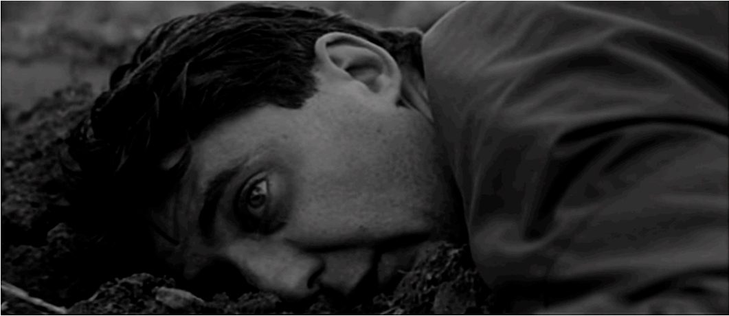
Abb. 2: L'humanité