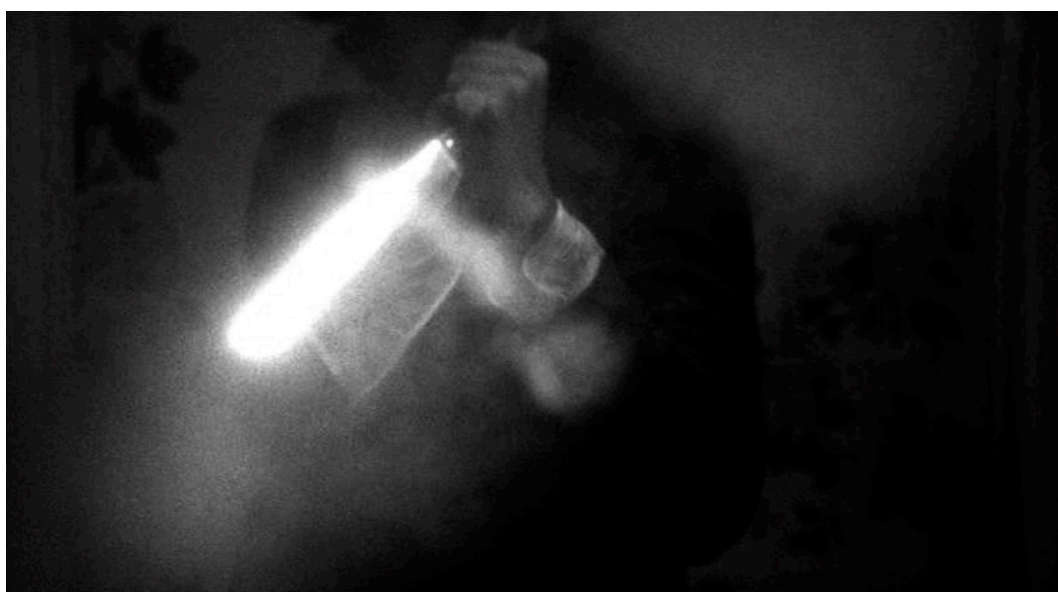
Abb. 5: Ambiger Killer in La casa con la scala nel buio .

In 4 mosche di velluto grigio stellt der Mörder sich als eine labile Frau heraus, die als Mädchen von ihrem Vater jahrelang misshandelt wurde. Der lehnte die Tochter ab, weil er lieber einen Sohn haben wollte, und zwang sie dazu, als Junge zu leben. Als die Frau nun einen Mann heiratet, der physiognomische Ähnlichkeiten