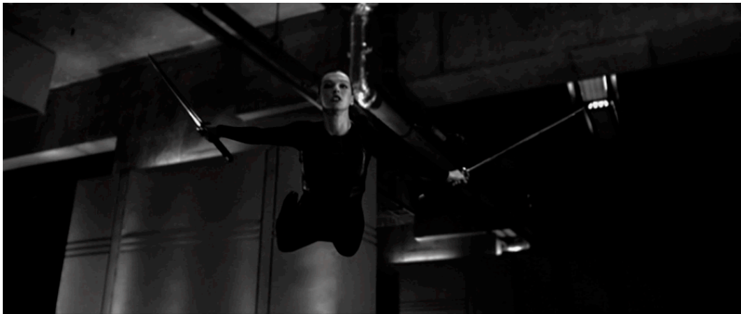
Abb. 1: Die Spielstrategie beherrscht den Plot und die Gestaltung des Kampfarraagements. Resident Evil: Afterlife referiert explizit auf The Matrix .

Eine zweite Strategie der militärischen Ermächtigung von Frauenfiguren im Film besteht in der sichtbaren Integration einer Waffenprothese in den weiblichen Körper, wodurch die Ästhetik von Verlust und Spiel eine andere Ausrichtung erhält. In Planet Terror wird das abgebissene Bein der Go-Go-Tänzerin Cherry Darling (Rose McGowan) durch ein Maschinengewehr ersetzt. The Machine Girl (J 2008) stattet die Schülerin Ami Hyuga (Minase Yashiro) mal mit einem Maschinengewehr, mal mit einer Kettensäge aus, die ihr jeweils an die Stelle des durch die Mafia amputierten linken Arms montiert werden.