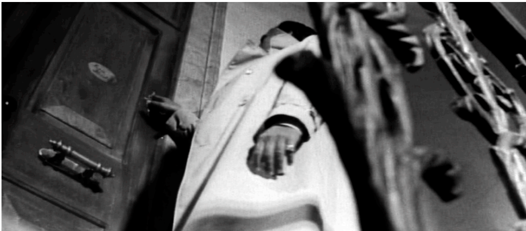
Abb. 6: Komplexe Blickdramaturgie in Sergio Martinos La coda della scorpione (Italien/Frankreich/D 1971).

Im Giallo sind eindeutige Grenzen des Geschlechts suspendiert, bipolare Modelle von maskulinen/femininen Blickfigurationen aufgehoben. Geradezu emblematisch könnte dafür Dario Argentos Il gatto a nove code (Italien/Frankreich/D 1971) stehen: mit einem Killer, der zu männlich ist, um ein Mann zu sein – der ein doppeltes Y-Chromosom besitzt.