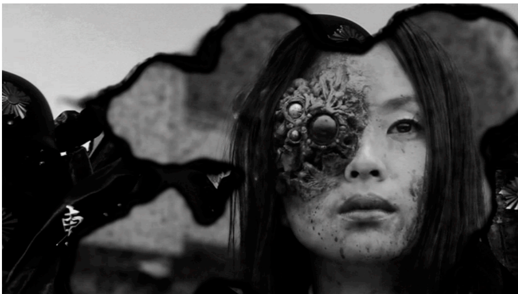
Abb. 5: Eine ›reine‹ Körperlichkeit, ohne funktionale Inbesitznahme der Kultur, ohne geschlechtsspezifische Zuschreibung und ohne narrative Qualität. Auf der Bühne im Bordell in Tokyo Gore Police .

In Tokyo Gore Police steht Ruka am Ende mit einem deformierten Auge da. Sie ist durch das zerschmolzene Werbungsbild der Polizei zu sehen, was auf die Verwerfung traditioneller Repräsentationsstrategien hinweist. Darüber hinaus verweisen einige Filme selbstreflexiv auf cineastische Macho-Diskurse, in denen die schwarze Brille als Symbol der Coolness von tough guys wie Mafiamitgliedern, Polizisten und dem Terminator (Arnold Schwarzenegger) gilt. Die Frauenfiguren eignen sich also ein machtvolleres Männlichkeitsimago an: Violet zerschießt im Kampf die Brille eines Mannes und trägt zugleich immer selbst eine. Im Laufe des Kampfes setzt sich Cherry die Brille eines Mannes auf.